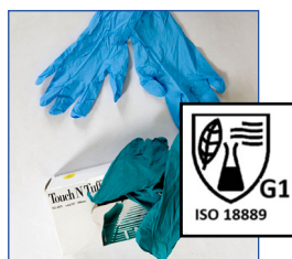
Jetables à manchettes à usage unique G1