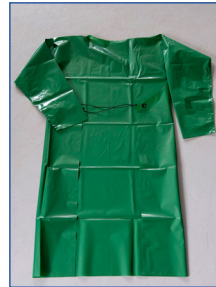
Tablier à manches longues PB[3] et C3

* Choix de la tenue de protection selon l'activité de travail : application au pulvérisateur à dos, à lance – Application au pulvérisateur sans cabine : forte intensité du contact avec la végétation Combinaison Préparation et incorporation de la bouillie – Nettoyage du matériel de traitement : Tablier de protection OU Combinaison