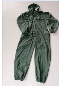
Réutilisable type 4/5/6