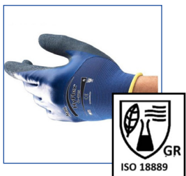
Gants de protection réutilisables en textile avec enduction nitrile* sur la paume des mains réutilisables pour les travailleurs de rentrée GR