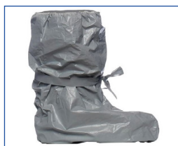
Jetables à usage unique