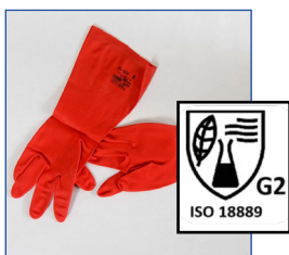
Réutilisables à manchettes G2