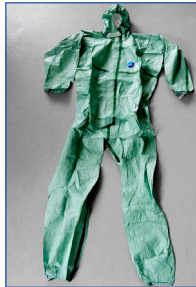
Jetable à usage unique type 3/4